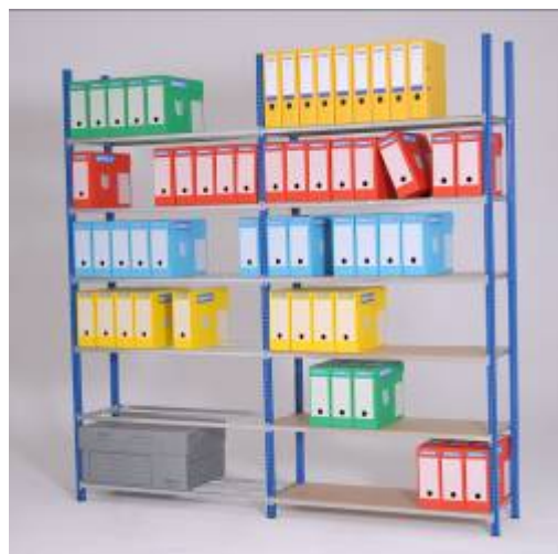
Photo : 1 Elément Départ + 1 Elément Suivant Hauteur 2000 mm, 5 tablettes Montants 2 x1000 mm avec jonction pour manutention facile en cartons